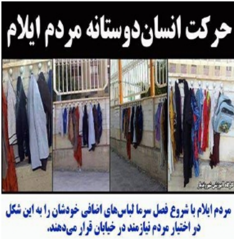
مردم ایلام با شروع فصل سرما لباس های اضافی خودشان را به این شکل در اختیار مردم نیازمند در خیابان قرار می دهند.

فساد گسترده در میان مدیران دولتی از دهه شصت با افشای اختلاس ۱۲۳ میلیاردی رفیق دوست رقم خورد و با ماجرای ۳۰۰۰ میلیاردی اختلاس مدیر عامل بانک ملی آقای خاوری به اوج رسید . اما این قصه پایانی ندارد و پدر خوانده های مافیایی ثروت و قدرت در فولاد آریا ، در خشکبار عسگر اولادی ، پدر خوانده نفت بابک زنجانی و پدرخوانده شرکت های هواپیمایی محسن رفسنجانی ... و دیگرانی که در صف افشای نامشان هستند، باقی مانده اند. در آخرین افشاگری محسنی اژه ای گفته است که رد پای ۱۵ تن از مسوولین سازمان ها و نهادهای مختلف در زمین خواری های زمین های حیران در میان است. سرمایه داری فرهنگ، اخلاق، سیاست، اقتصاد خود را دارد و رواج می دهد. فرهنگ سرمایه داری تنهایی و خود پرستی است ، اقتصادش وابسته به خارج و