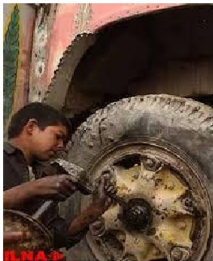
Iranian Labour News Agency