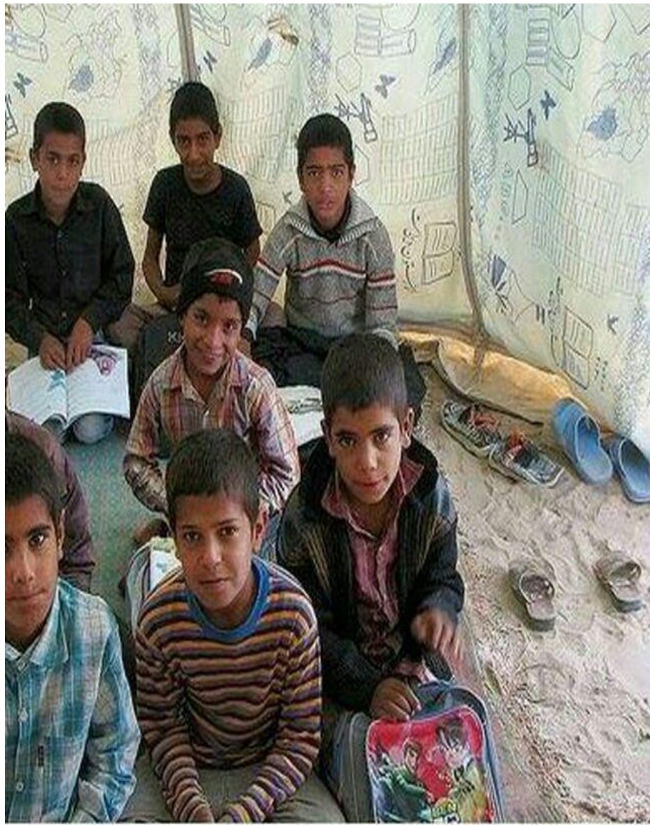
مدرسه غیر صندلی، غیر مدادی، غیر دفتری، غیر کفشی